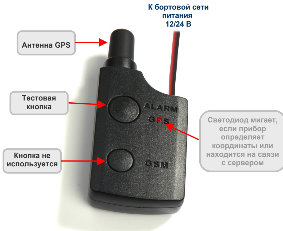
Рис.7.3. Внешний вид «Вояджера 4».

Нажмите тестовую кнопку (рис.7.3), «Вояджер 4» перейдет в «Дежурный режим».